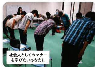
ビジネスマナー講座