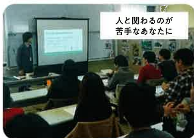
コミュニケーション講座