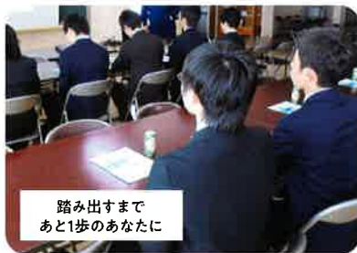
就活セミナー (面接・履歴書指導など)