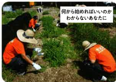
集中訓練プログラム