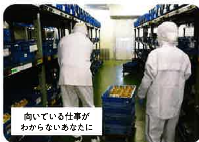
ジョブトレーニング