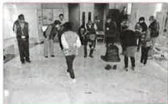
プロジェクションマッピングで自分の家を探しました