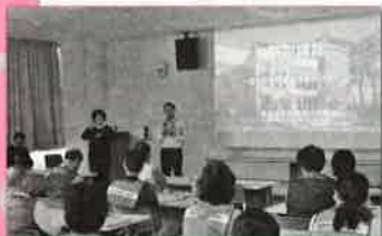
防災対策課の講話

※防災ボランティアコーディネーターとは…大規模な災害が発生した時、ボランティアによる救援・救助活動が円滑、かつ効果的に行われるよう、市と社会福祉協議会とで設置する災害ボランティアセンターでボランティアと被災者との調整を行う人材のことです。