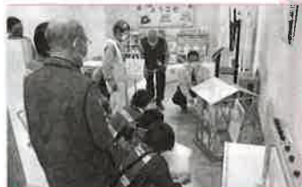
模型で耐震構造の実験

●問い合わせ先 豊川市社会福祉協議会ボランティアセンター 豊川市諏訪3丁目242番地 豊川市社会福祉会館「ウィズ豊川」内 ☎(0533)83-0630 FAX(0533)89-0662 Mail:t-shakyo0630@etude.ocn.ne.jp