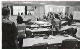
災害対策本部の見学 (普段はこの中に入れてません)