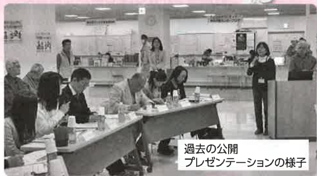
過去の公開 プレゼンテーションの様子

※新型コロナウイルス感染拡大防止の観点から中止となる場合がありますので、ご承知おきください。