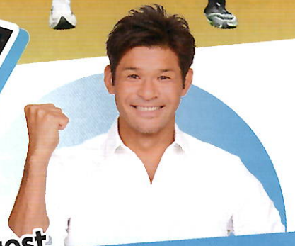
Guest タレント・俳優 照英さん